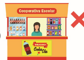
6 No permitir la publicidad de alimentos y bebidas ultraprocesados al interior de la escuela