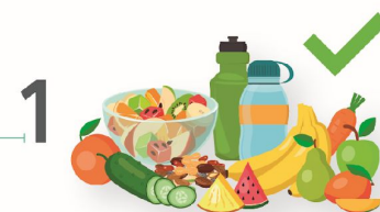
1 Vender frutas y verduras diario

La presencia o ausencia de estos siete elementos determina si el entorno escolar facilita el acceso y disponibilidad de alimentos y bebidas adecuados para proteger los derechos de la infancia y promover estilos de vida saludables