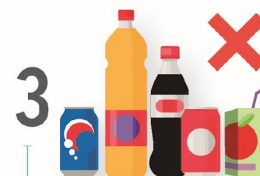
3 No vender refrescos ni bebidas azucaradas