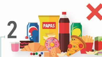
2 No vender alimentos ultraprocesados