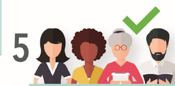
5 Contar con un Comité de Establecimiento de Consumo Escolar (CECE)