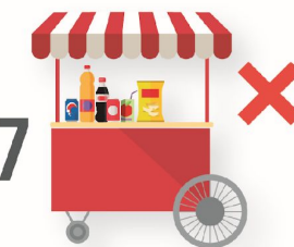
7 No permitir la venta de alimentos y bebidas ultraprocesados al exterior de la escuela