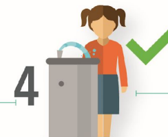
4 Proveer agua de calidad para beber